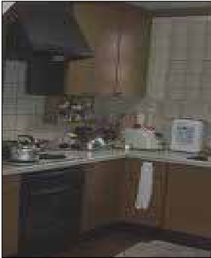
リフォーム前【写真】