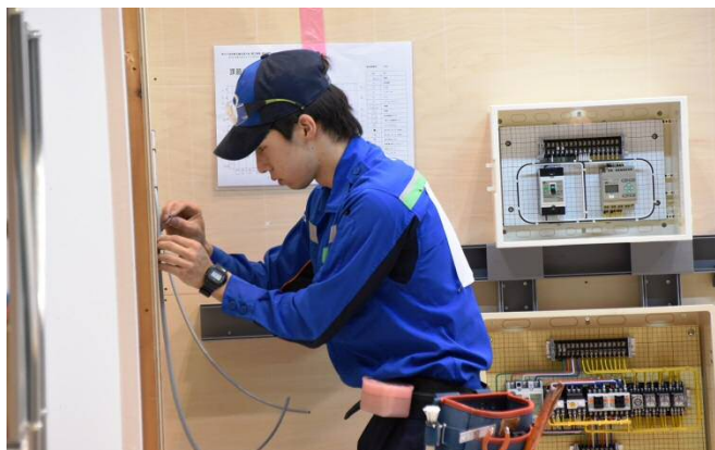
<銅賞を受賞した生村選手>