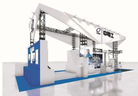
当社出展ブース（イメージ）