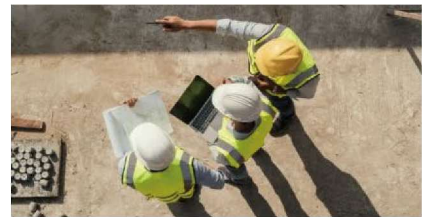
チームの流れを “自然に”繋げる