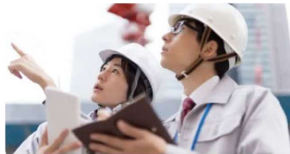
バラバラの情報に “たった一つ”の居場所を