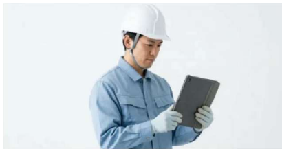
出面管理をスマートに これからは“顔認証で入退場”