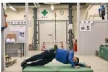
ぶら下がり体験（胸ベルト）