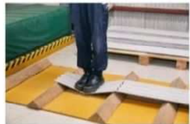
スレート屋根踏み抜き体験