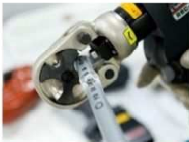
機械装置挟まれ体験