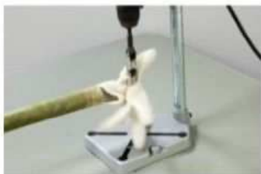
回転機器巻き込まれ再現