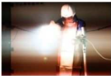
低圧充電線路短絡体験