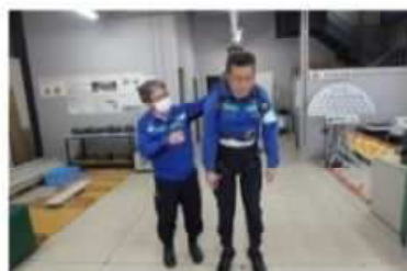
ぶら下がり体験（フルハーネス）