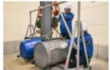
ワイヤー挟まれ体験