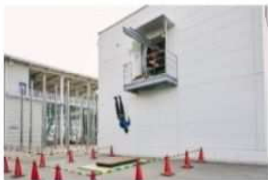
地上への墜落再現