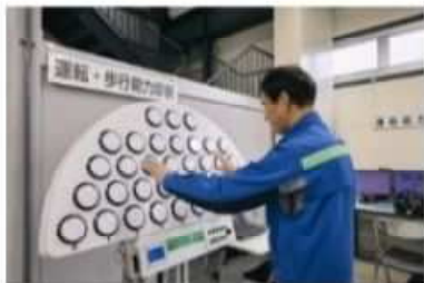
運転・歩行能力診断(点灯くん)体験