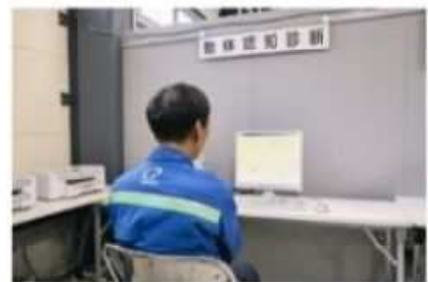
視覚機能診断(ビジくん)体験