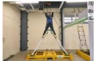
脚立の開き・横倒れ体験