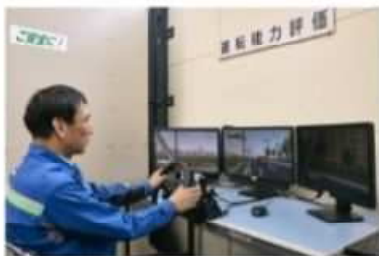
運転シミュレーター(セーフティナビ)体験