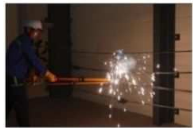
低圧線間短絡再現