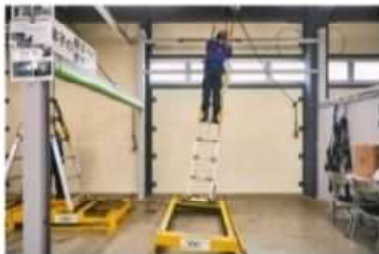
梯子の横・縦すべり体験