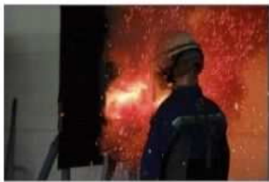
低圧計器短絡再現