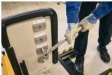
ボルトの切断体験