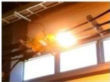
高圧線間短絡再現